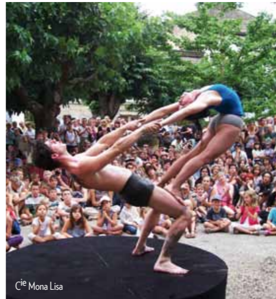
Cie Mona Lisa

> Spectacle tous publics présenté par la compagnie Cirqui'Envol.