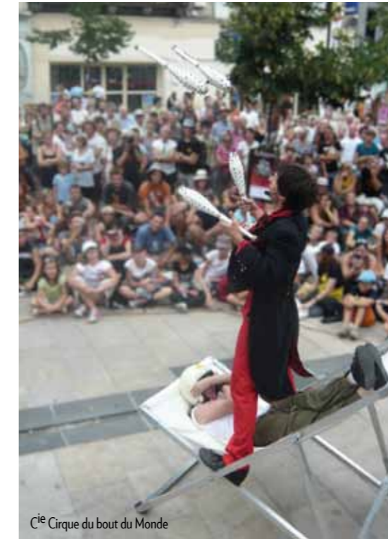
Cie Cirque du bout du Monde

> Spectacle tous publics présenté par la compagnie Rat Dit Noir.